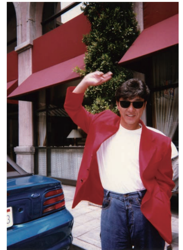
1994年LAロケの合間でのオフショット。

それでもかち各地を襲ってくる自然災害の脅威、人口減少・少子化問題、環境汚染、円安による物価高騰、恐ろしく身近に迫る「闇バイト」の犯罪など心配の種はつきません。けれども、戦後80年、ゼロから復興を果たした日本。竹は節目で伸びていくといいます。昭和のおおらかさを大切に、ピンチはチャンス。変化を面白いと感じる感性とエネルギー溢れる若者たちが増えていくことを願いながら、私たち大人も、日本人の良心を軸に、温故知新、成長していきたいと強く思います。この試練にもきっと終わりが来るはずですよ。