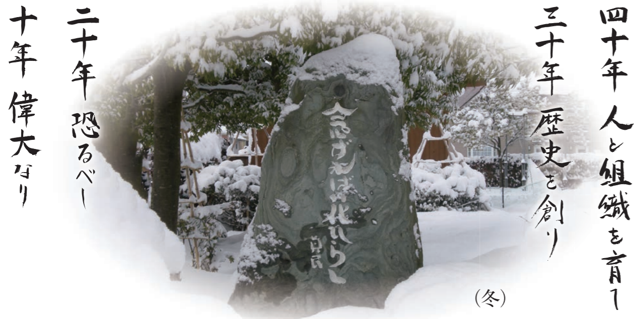
1991年、徳真会グループ創業10周年を記念し、新潟市に全国で171番目、172番目となる「念ずれば花ひらく」の石碑を設立。故 坂村真民先生（当時82歳）に御来新頂き、入魂式を行いました。